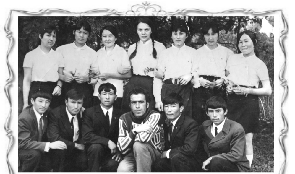
Ногай районунын Куьнбатар авыл орта мектебин 1974-нши йылда бирге оқып кутарган йолдасларга

Ногай район прокуроры юстициядын киши маслагатшысы.