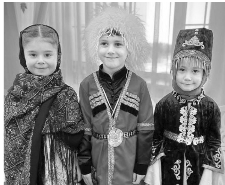
Коьк аспаннан яркын нурлар тоьгилеп, Коьнъилимди оьр этеди куьлкиси. Халк бирлигин берк этеди саббийлер, Дослык йьрын заньыраткан тавысы.