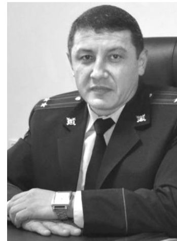
канагатлав шаралар озгарыла- як.

Сайлав комиссиясынынъ эм граждандлардынъ тавыс беруьвлери тийисли йорыкта оьтсин деген ниет пен, аьр бир сайлав участокта полиция нарядлары ис аьрекетин бардыраак эм аьр кайсы сайлавлар оьтетаган участокта ямагат кавыфсызлыгын