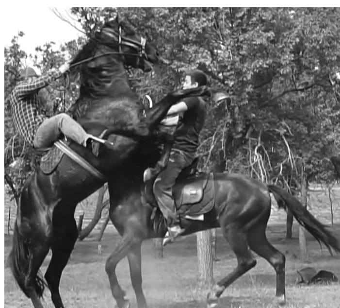
акшалай баргылары ман савгандылар.

Кызыкты ярысында бес туьрли шеккили категориялар бойынша отыздан артык йигитлер катнастылар эм кубоклар, медальлер эм