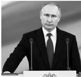
Навруз айдын ишинде Владимир Путин Россия Президентинин сайлауларында

еншип, бесинши кере элимиздин басшысы болды. Бугуьн, курал айынын 7-нши куьнинде, 12 саатте, Владимир Путин Кремлевский дворецндегн Андреевский залында официаллы кепте ис орынына туьседн. Инаугурациядын куьни эм саати 2000-нши йылда беркитилген.